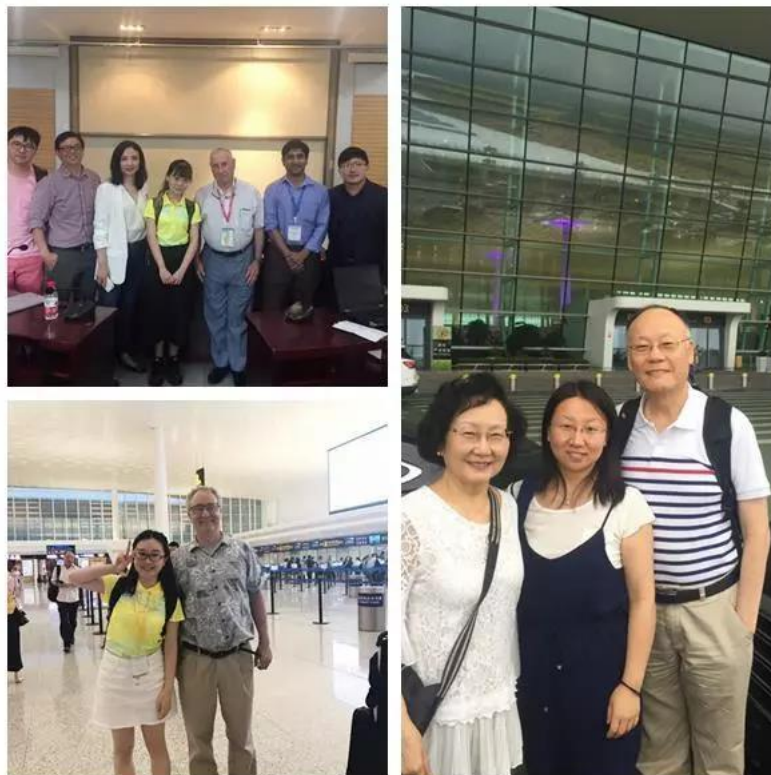
▲ 志愿者 嘉宾 秘书 与 参会 嘉宾 合影