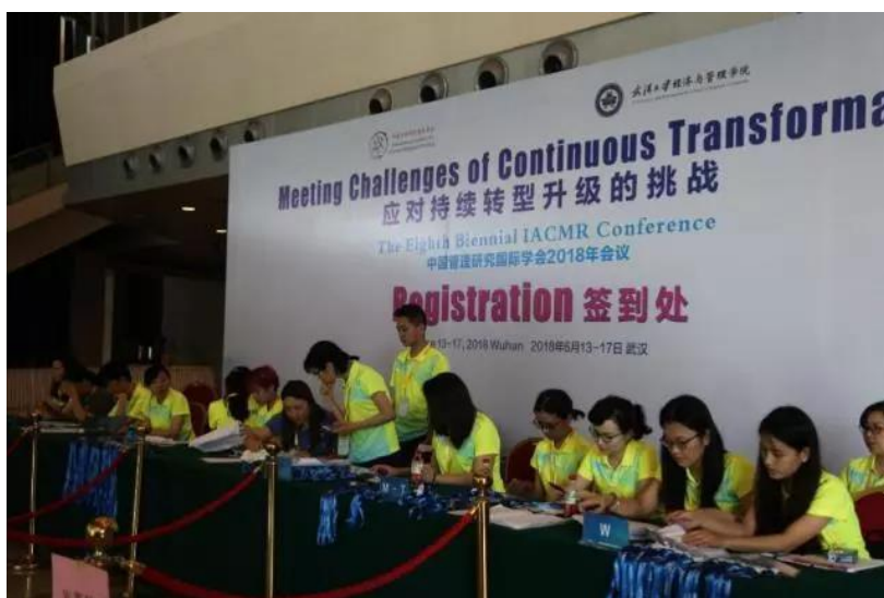
▲ 志愿者正在准备注册签到材料

6月14—17日，由武汉大学经济与管理学院承办的第八届中国管理研究国际学会年会顺利召开，会议期间学院的志愿者展现了昂扬向上和乐于奉献的精神品质，确保了会议的顺利召开，让我们来一睹志愿者的风采。