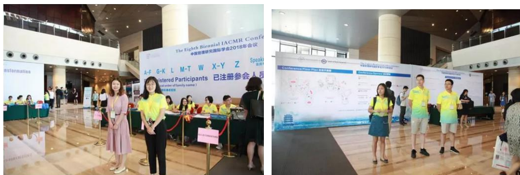
▲ 志愿者列队指引和欢迎嘉宾