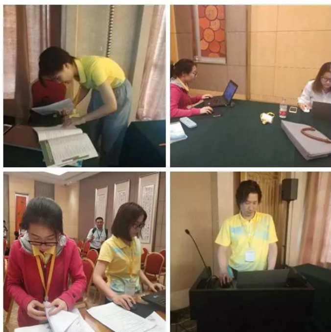
▲ 志愿者正在热火朝天地准备各会议厅会前材料