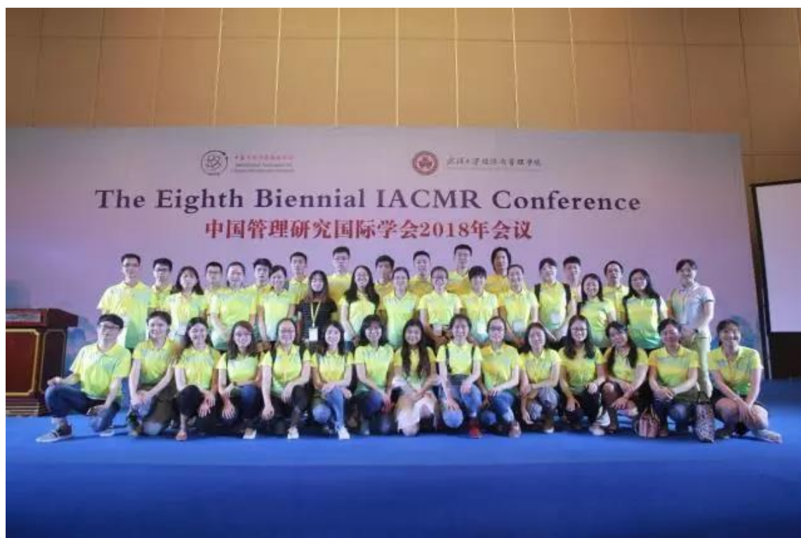
▲ 志愿者们在闭幕晚宴上合影留念

我们记录的只是会议的小部分，并未记录全部志愿者为大会作出的贡献，感谢为此次会议辛苦付出的志愿者。