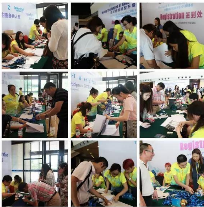
▲ 志愿者们以热情周到的服务接待前来注册签到的嘉宾